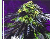
Haze 19x Skunk 46,00EUR